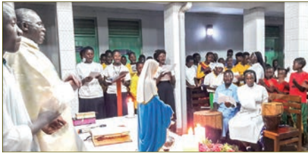
우간다 진자 지역에서의 미사. 사진 오른쪽은 주일학교 어린이들.