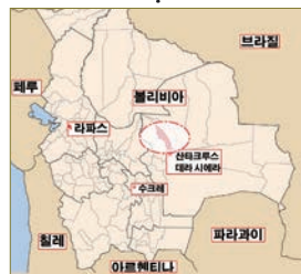
성가소비녀회가 사목하는 볼리비아 산타크루스주 ‘산타 로사 델 사라’ 로스안데스 공소지역 (타원 표시)

자세히 알도록 하고, 매일 조금씩이라도 성경을 읽고 쓰는 습관을 들일 계획입니다. 성경 말씀을 내면화하여 길을 잃고 방황하는 청소년들에게 어떻게 살아야 하는지 인생의 나침반이 되어줄 수 있을 것입니다. 어린이들에게는 어린이 성경책을 어려서부터 읽게 해서 성경에 대한 접근성을 높이고 말씀을 통하여 신앙심을 고취시킬 생각입니다. 성경을 알아감으로써 현재 우리가 안고 있는 문제들의 해답을 찾을 수 있고, 하나님께