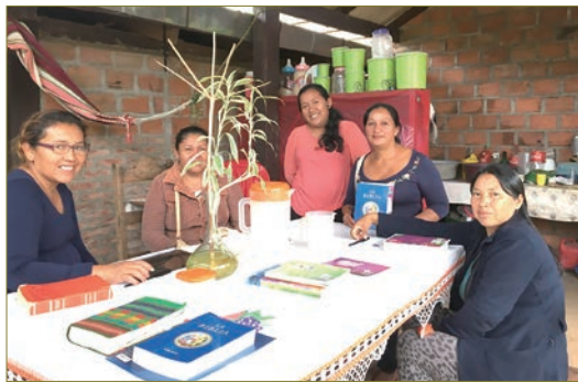
사진 위는 국성회가 2022년에 후원한 볼리비아 콘셉시온 지역에서의 미사 장면. 아래는 볼리비아 콘셉시온 지역 신자들이 성경을 받고 기뻐하는 모습.

성경책을 접해본 아이들이 거의 없었습니다. 가격도 비싼데다 최소한 5시간 이상은 차로 이동해야 살 수 있기 때문에 성경을 구입하라는 말도 못하고 어려움을 겪고 있었습니다. 그러던 중에 콰드르에서 선교하고 계신 수녀님을 통해 국성회에서 성경책을 후원받을 수 있다는 정보를 듣고 반가움에 이렇게 신청을 하게 되었습니다.