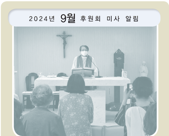
2024년 9월 후원회 미사 알림

일시 : 2024년 9월 10일 (화) 오전 11시 장소 : 요셉의원 3층 경당(서울시 영등포구 경인로100길 6) 교통 : 지하철 1호선 영등포역 6번 출구에서 문래동 쪽 200m