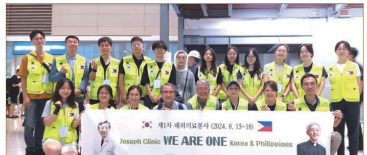
출국 전 인천공항에서 포즈를 취한 의료봉사단(2024년 8월 15일).