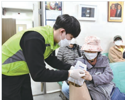
이 봉사자는 환자들에게 설명이 필요할 때는 “최대한 자세를 낮추고 상냥하게 말씀드리려 한다”고 말했다.