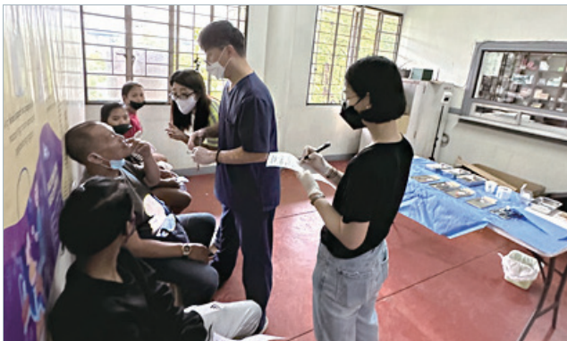
치과 진료실 장면.